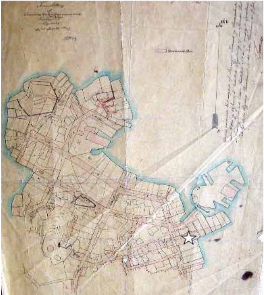
Premierløytnant Hielms opptatte kart over brannstedet. De nye gatene er inntegnet med rød farge; bl.a. Bakkegt., Breigt., Øvre og Nedre Holmegt. «Stjernen» angir stedet hvor brannen oppstod; nedre delen av nåværende Breigt.

vindstille, tok det bare godt og vel en time før ilden var under kontroll. Men etter at faren var over, utbrøt en gammel kone: «Vårherre ville denne gang bare vise oss riset!» Det lød som en uhyggelig profeti som snart skulle gå i oppfyllelse.